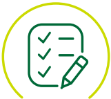
Houden van een LMRA

Het doel van een Laatste Minuut Risico Analyse (LMRA) is dat je met elkaar op de werkplek de mogelijke risico's van de werkzaamheden bespreekt.