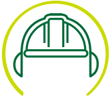
Dragen van PBM's