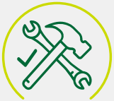
Materieel & gereedschap is gekeurd en wordt juist toegepast

We zorgen dat machines, gereedschappen en ander materieel gekeurd zijn en op de juiste manier worden gebruikt en onderhouden. Bij gebruik hiervan kijk je: